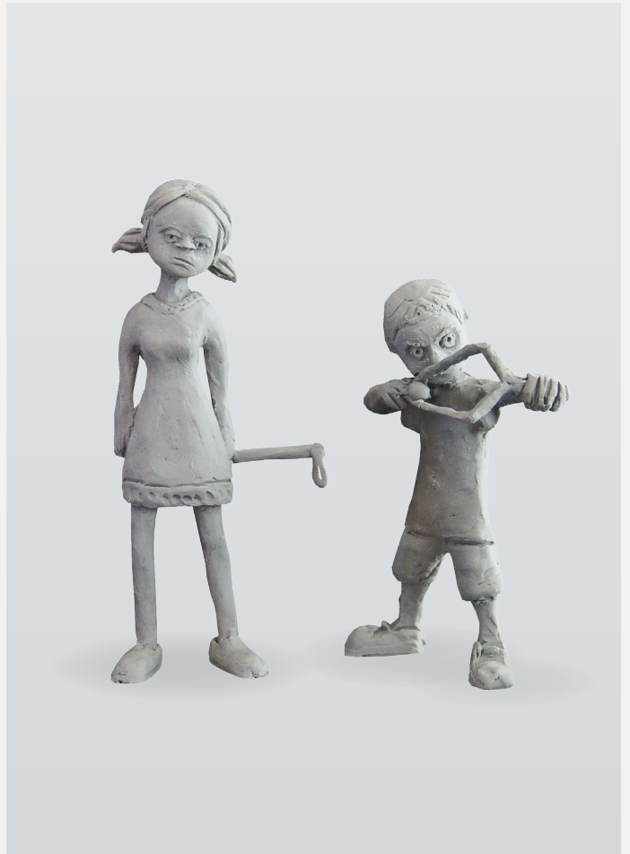
Meine persönliche Spezialität: Das Modellieren und Illustrieren mit Platillin