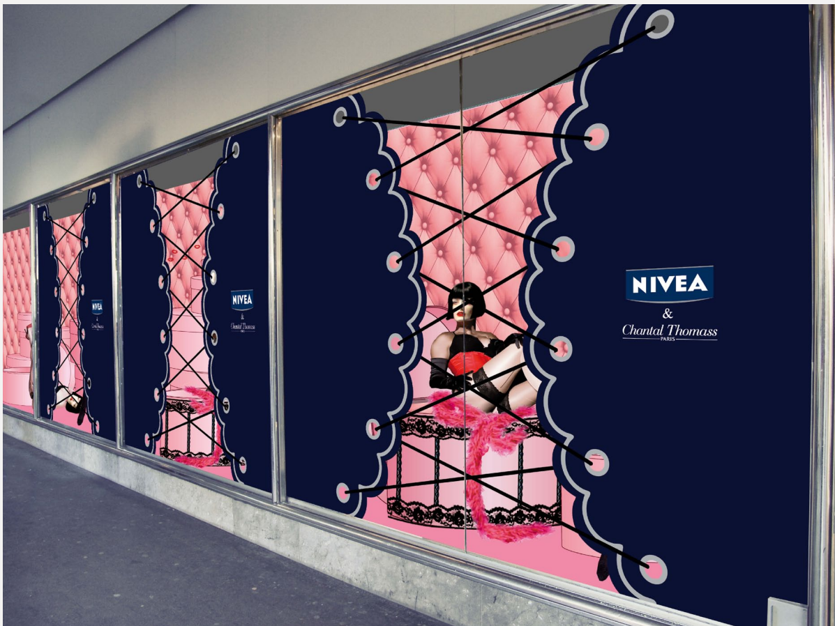
Photoshop-Montagen für Schaufenstergestaltung