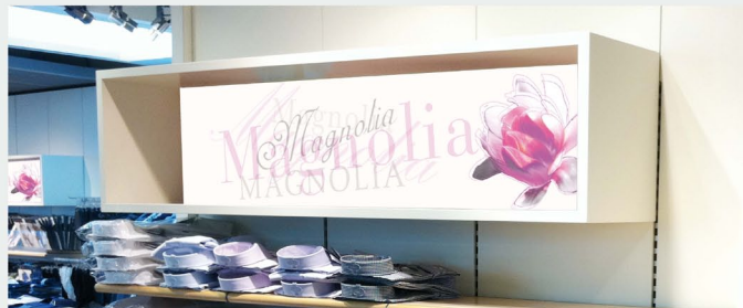
Wandkästen für Parfümerie und Filialdekoratoin